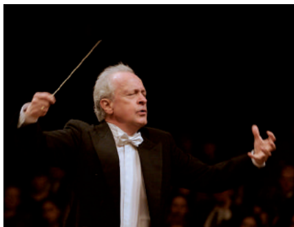
Antoni Wit director

Antoni Wit es uno de los directores más respetados de Polonia y un gran conocedor de la música polaca.