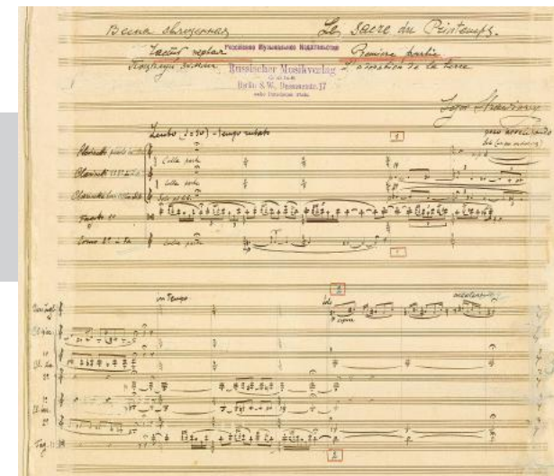
Manuscrito de La Consagración de la primavera

El día del estreno hubo tal desconcierto entre el público asistente, que tuvieron que llamar a la policía para calmar los ánimos. Pero ¿qué fue lo que desató los gritos de desaprobación, las salidas del teatro, las persecuciones, incluso, entre los que desaprobaban y los que intuían que algo nuevo estaba naciendo? Lo que sucedió es que el público se encontró ante un ballet que rompió los esquemas existentes hasta entonces al presentar una estética inspirada en ritos ancestrales paganos que se alejaba de toda concepción más clásica. Los movimientos bruscos y violentos de los bailarines se consideraron poco menos que una coreografía con connotaciones sexuales y bárbaras.