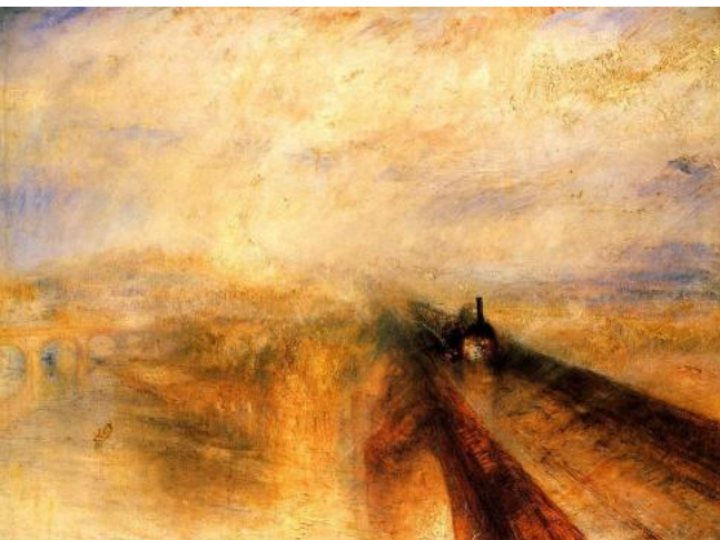
Joseph Mallard William TURNER, "Rain, Steam and Speed: The Great Western Railway" ca. 1844. (National Gallery, Londres)

El tren cruza el río Támesis llevando el pasaje hacia la modernidad. El cuadro simboliza ese cambio que llevó consigo la revolución industrial y que empezaba a transformar los paisajes y la sociedad misma.