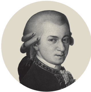
WOLFGANG A. MOZART (1756-1791)

En vez de presentarse ante nosotros como una simple introducción al drama, Leonora n.º 3 nos anticipa el contenido de manera mucho más completa y sugerente de lo que nos aparece acto seguido en la acción no siempre bien hilada. La Leonora pues no merece el nombre de obertura: es el drama mismo elevado a su más alta potencia.