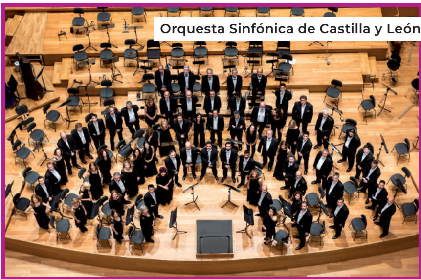
Orquesta Sinfónica de Castilla y León