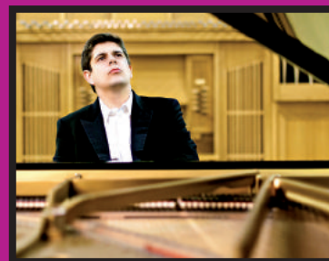
Javier Perianes piano

La carrera internacional de Javier Perianes lo ha llevado a actuar en las salas de conciertos más prestigiosas del mundo y con las principales orquestas, colaborando con directores como Daniel Barenboim, Charles Dutoit, Zubin Mehta, Gustavo Dudamel, Yuri Temirkanov, Gianandrea Noseda, Vladimir Jurowski, Gustavo Gimeno, Simone Young, Juanjo Mena y Klaus Mäkelä, y actuando en festivales como los BBC Proms, Lucerna, La Roque d'Anthéron, Primavera de Praga, Granada, Vail, Blossom y Ravinia. Javier Perianes es Premio Nacional de Música 2012 y Artista del Año 2019 de los ICMA.