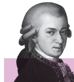
WOLFGANG AMADEUS MOZART (1756-1791)

Hay obras de música que conquistan el corazón de todos los humanos, tan bellas y cautivadoras que costaría imaginar el arte y la vida sin ellas, melodías que parecen eternas, que tienen que haber estado ahí desde siempre y que forman parte de la memoria colectiva, de ese subconsciente cultural occidental en el que también están por ejemplo El Quijote , la Mona Lisa o la torre Eiffel. Muchas de estas obras musicales salieron de las mentes maravillosas de Mozart y Beethoven, y algunas van a sonar esta tarde, en esta sala.