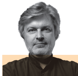
JAMES MACMILLAN (1959)

A menudo los libros de historia de la música destacan como un gran avance la libertad que adquirieron los compositores en el siglo XIX al librarse de los mecenas cortesanos y de la iglesia. Sin embargo esta liberación fue muy relativa, porque simplemente los compositores pasaron a ser tener otros “amos” y a menudo, por menos concretos, más difíciles de satisfacer. ¿Fue más libre Shostakóvich, siempre obligado a navegar por mares difíciles como eran los de la política cultural soviética? ¿Lo era cuando inició su Décima sinfonía prácticamente en secreto y aún hoy hay muchas dudas sobre su proceso compositivo? ¿Lo es MacMillan cuando se ve obligado a satisfacer a un público que siempre busca ser agradado pero al tiempo requiere originalidad por parte del compositor, a un público que habiendo disfrutado de su Concierto para percusión n.º 1 , tanto en conciertos como en grabaciones, quería algo igual pero distinto en el segundo?