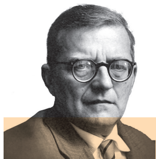
DMITRI SHOSTAKÓVICH (1906-1975)

Hay más retos técnicos. Hay más combinación de instrumentos. Tiene un uso muy actualizado de los instrumentos de percusión. Es un modo fascinante de mostrar qué es lo que puede hacerse con la percusión.