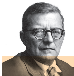
DMITRI SHOSTAKÓVICH (1906-1975)

Hay más retos técnicos. Hay más combinación de instrumentos. Tiene un uso muy actualizado de los instrumentos de percusión. Es un modo fascinante de mostrar qué es lo que puede hacerse con la percusión.