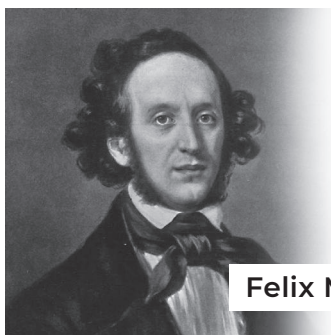
Felix Mendelssohn-Bartholdy, 1809-1847

Uno de los privilegios más placenteros para un joven con medios económicos importantes de principios del siglo XIX era disfrutar el Grand Tour , un viaje que con frecuencia duraba varios años y cuyo objetivo era explorar Europa mediante estancias en hermosas ciudades a la vez que se establecían relaciones de clase. El Grand Tour se convirtió en un elemento clave de la educación de las clases altas, y proporcionaba temas de conversación elegantes, inagotables y cultos. Fue, además, un fenómeno que influyó profundamente en muchos artistas y escritores del Romanticismo: Byron, Stendhal, los Shelley, Goethe y tantos otros buscaban una habitación con vistas en Florencia, Roma o Atenas que estimulase su imaginación creativa y, si había suerte, también la pasión amorosa.