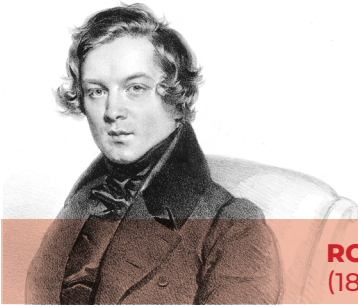
ROBERT SCHUMANN (1810-1856)