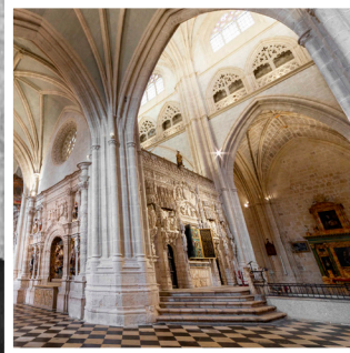
S. I. Catedral de Palencia