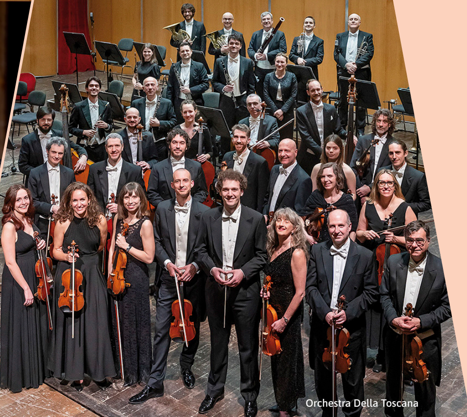
Orchestra Della Toscana

JUEVES 26 [ 19:30 H ] CENTRO CULTURAL MIGUEL DELIBES. VALLADOLID SALA SINFÓNICA JESÚS LÓPEZ COBOS