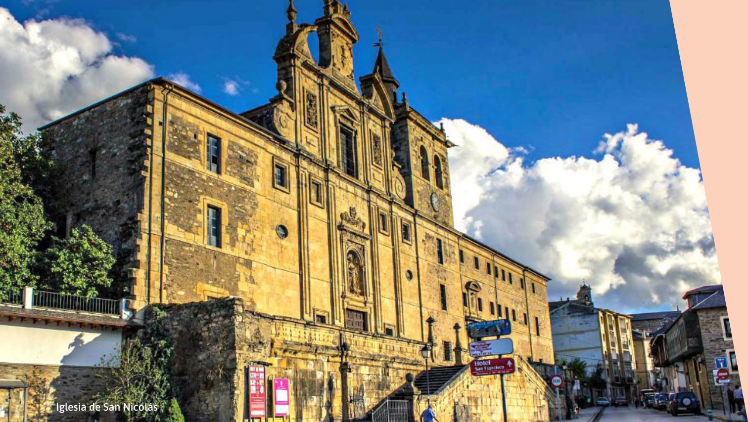
Iglesia de San Nicolás