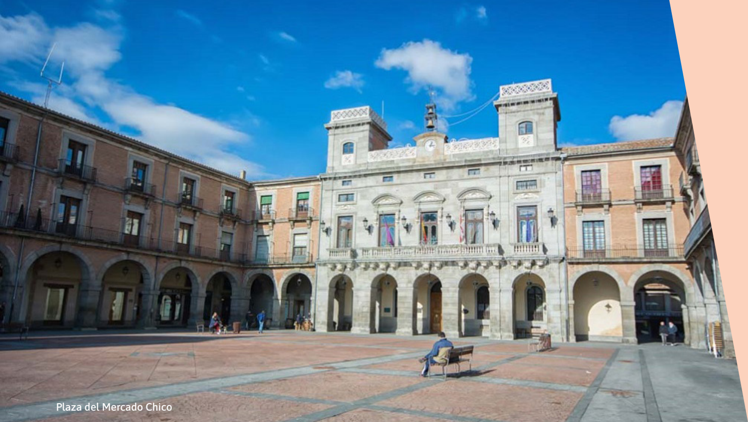
Plaza del Mercado Chico

DOMINGO 5 DE JULIO [ 21:30 H ] PLAZA DEL MERCADO CHICO. ÁVILA