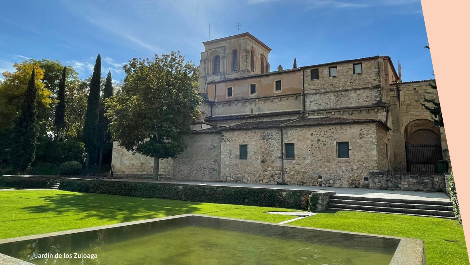
Jardín de los Zuloaga

JUEVES 16 DE JULIO [ 22:00 H ] JARDÍN DE LOS ZULOAGA. SEGOVIA