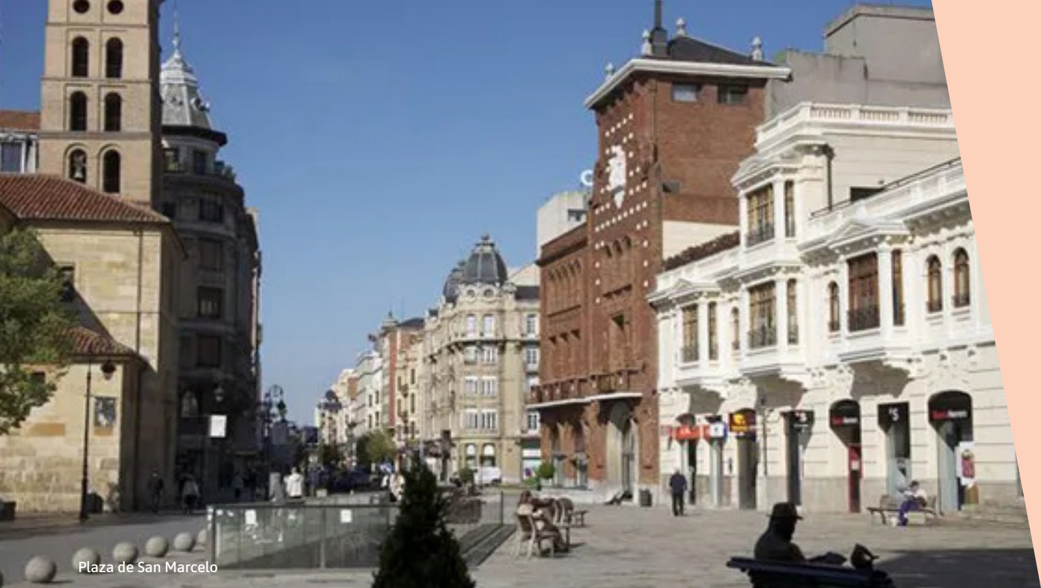
Plaza de San Marcelo

MIÉRCOLES 8 DE JULIO [ 21:30 H ] PLAZA DE SAN MARCELO. LEÓN