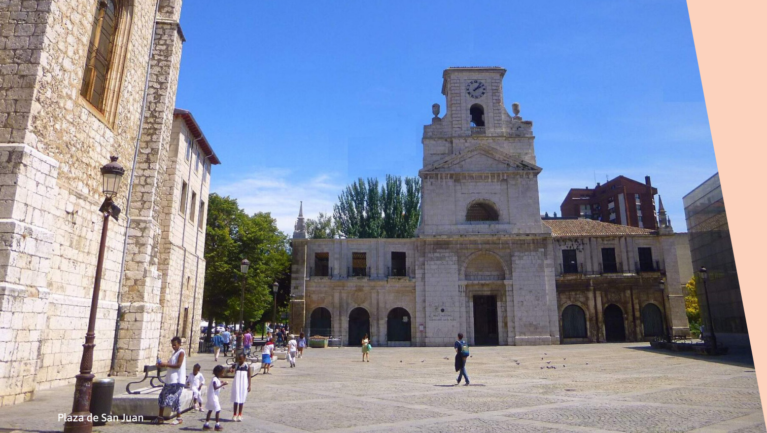
Plaza de San Juan

VIERNES 10 DE JULIO [ 21:00 H ] PLAZA DE SAN JUAN. BURGOS