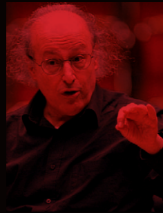
ELIAHU INBAL DIRECTOR